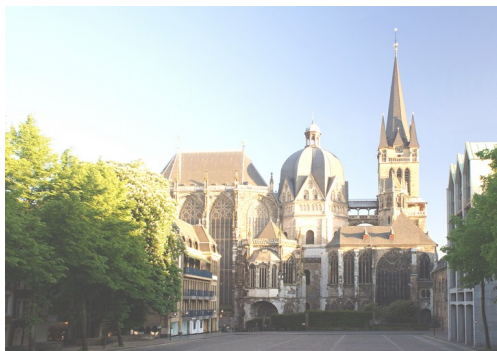
Un lieu de culte : Une cathédrale

Penses-tu qu'on sait pourquoi la société s'organise, si on ne sait pas pourquoi il y a la vie ? Ceci est une quête de recherche de vérité.